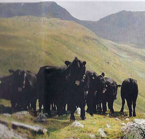
Die Herde verbringt den Sommer auf der Alp Muottas Muragl.