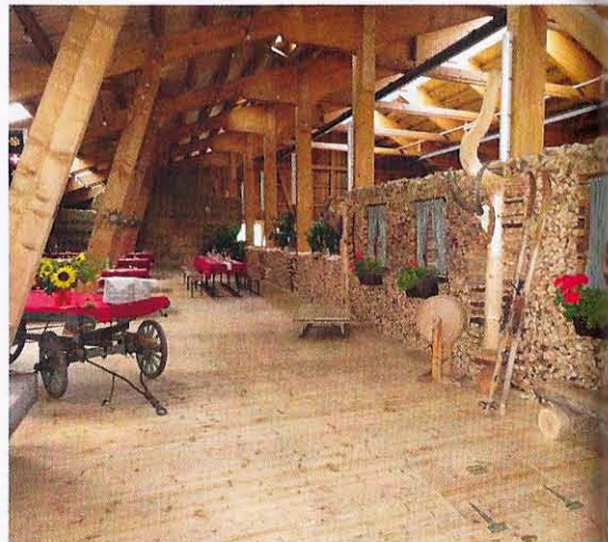
Die Diskussionsrunde zur Wolfsproblematik fand im gemütlichen Ambiente statt.